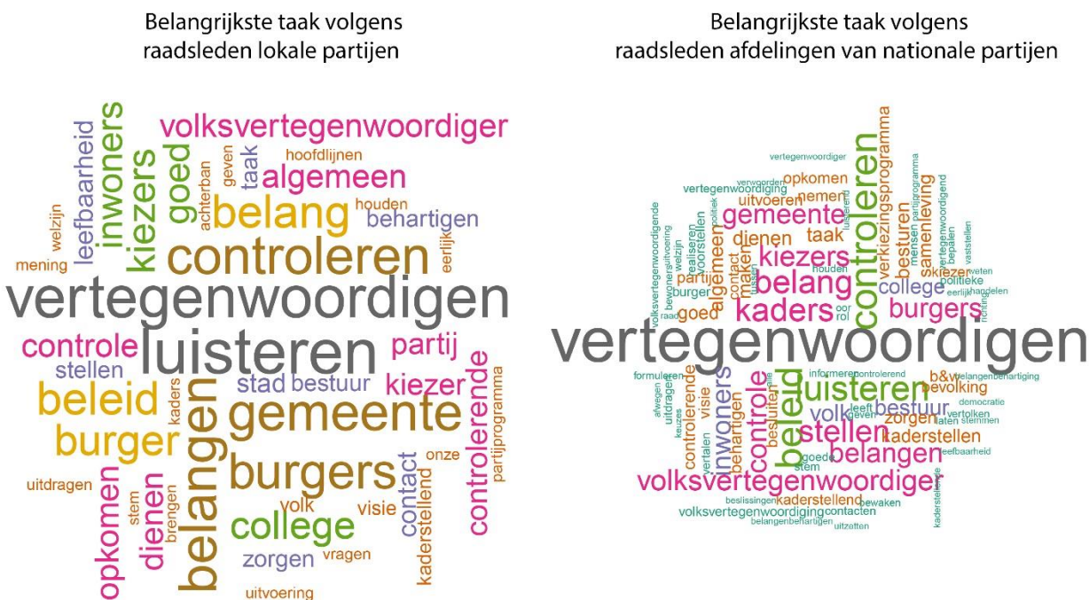
Figuur 3. Wordcloud van wat volgens raadsleden hun taken zijn (Van Ditmars 2016)

Verschillen tussen beide soorten raadsleden zijn er ook voor wat betreft politiek cynisme. Raadsleden van lokale partijen zijn niet alleen cynischer dan raadsleden van niet-lokale partijen, bij twee van de drie stellingen zijn ze ook cynischer dan inwoners. Zie tabel 16. 20