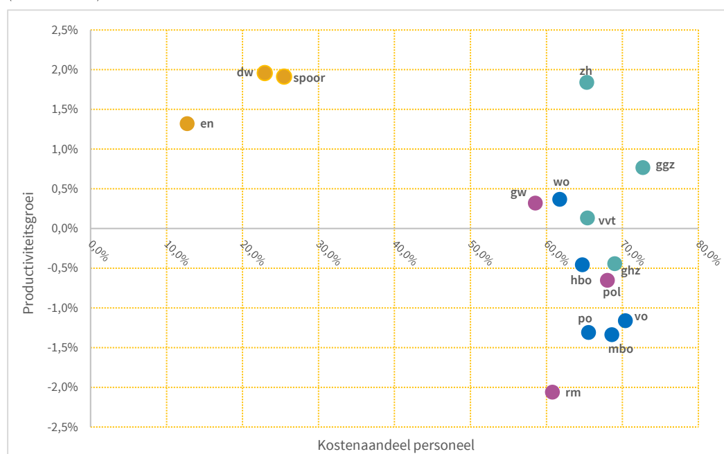
Figuur 4-1 Samenhang tussen jaarlijkse productiviteitsgroei en kostenaandeel personeel; vijftien sectoren 1980-2017 (Baumol-effect)

In figuur 4-1 zien we dat in de arbeidsextensieve sectoren, zoals de drinkwatersector, de gemiddelde productiviteitsgroei het hoogst is. In het cluster van sectoren met een hoge arbeidsintensiteit zien we een grote variatie in de gemiddelde productiviteitsgroei. Van een lineair verband tussen arbeidsintensiteit en productiviteit lijkt op het eerste gezicht dan ook niet echt sprake. Uit de multivariate analyse die hierna nog volgt, zal echter blijken dat hier een belangrijke controlevariabele ontbreekt.