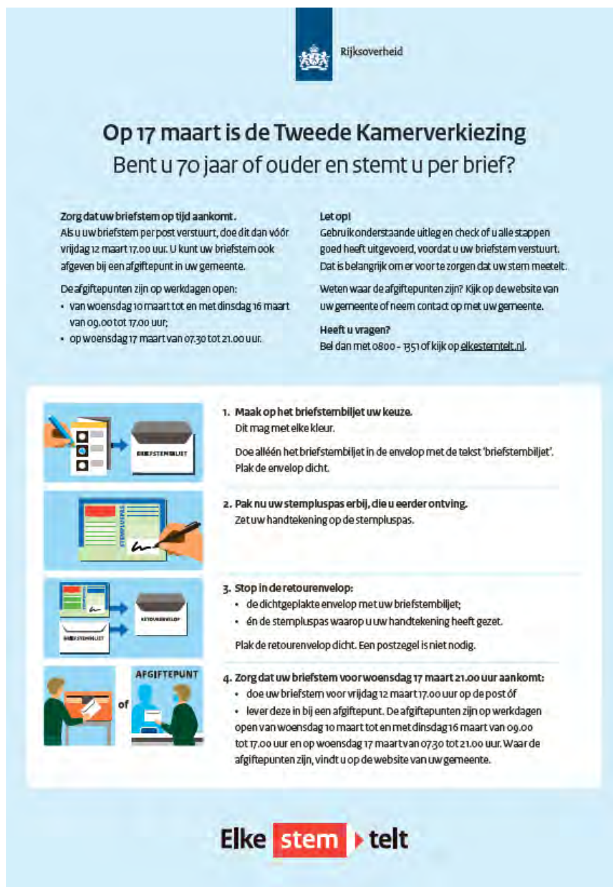
Advertentie met uitleg over briefstemmen

Geconstateerd kan worden dat alleen de inzet van alle communicatiemiddelen niet toereikend is om het aantal terzijdeleggingen in een nieuw proces van stemmen te helpen voorkomen.